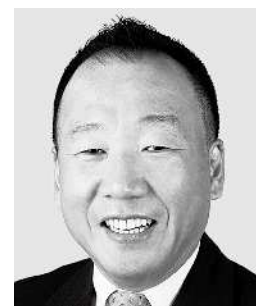
おおしま くす お 大島 九州男 参議院議員 現職 平和憲法の精神を 守ります