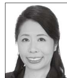
若林 アキ 党女性局長 ジャーナリスト