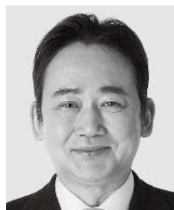
いしがみ 石上 としお 参議院議員 現職 全力で稼ぐ。全力で届ける。 全力で挑む。