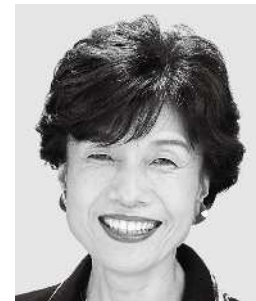
まどか こ 円 より子 元参議院議員 元職 世直しおばあ、 子育て世代全力応援