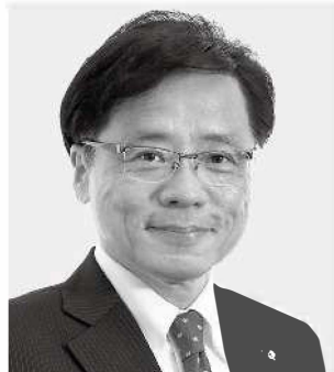
党参院幹事長・国対委員長 井上 さとし 現 61歳。参院議員3期。 活動地域 東海、北陸信越、京都