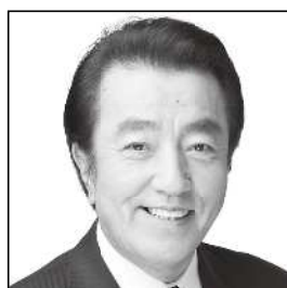
日本維新の会参議院幹事長 元国土交通大臣政務官 むろい 邦彦 子や孫たちに 夢をつなぐ国づくり