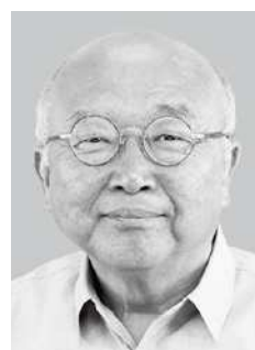
おまた へい 新・67