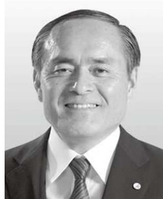
よし だ 吉田 ただとも 社民党前党首、元参議院議員、 大分県ウエイトリフティング協会会長 【私のこだわり】 雇用労働、農林水産振興 子育て・教育、地方自治、交通