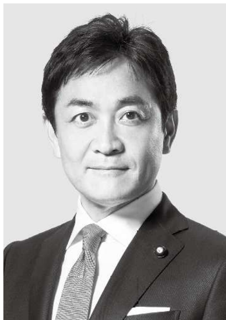
国民民主党 代表 玉木雄一郎