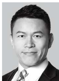
須藤 元気 新・41