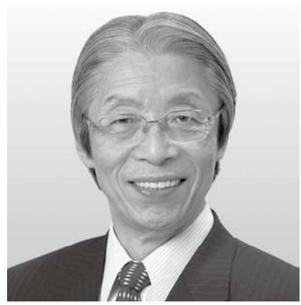
[党首] 又市 征治