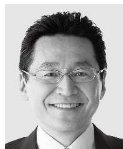
てつじ いそざき 哲史 参議院議員 現職 仲間の思い、 かたちにしたい。