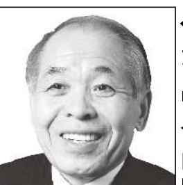
元衆議院議員/元国務大臣 北海道・沖縄開発庁長官 鈴木 宗男 政治に喝! 北方領土問題解決