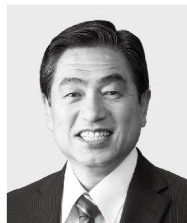
わか まつ 若松 かねしげ 現 役職:元復興副大臣。参院議員1期。 経歴:中央大学二部卒。公認会計士。 税理士。行政書士。 年齢:63歳 「現場第一」で復興・防災に全力