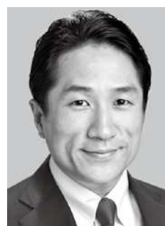
川田 龍平 現・43