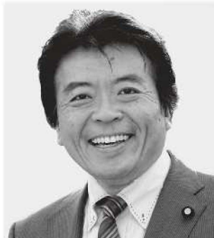
弁護士 仁比 そうへい 現 55歳。参院議員2期。党参院国対副委員長。 活動地域 中国、四国、九州・沖縄