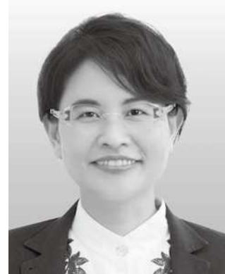
なか むら 仲村 みお 前沖縄県議、沖縄平和運動センター副議長 自治体議員立憲ネットワーク共同代表 【私のこだわり】 地方自治、沖縄振興、子どもの貧困 子育て・教育、医療・福祉、基地問題