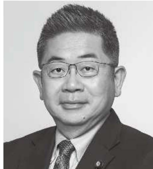
党書記局長 小池 晃 現 59歳。参院議員3期。全国革新懇代表世話人。医師。 活動地域 東京