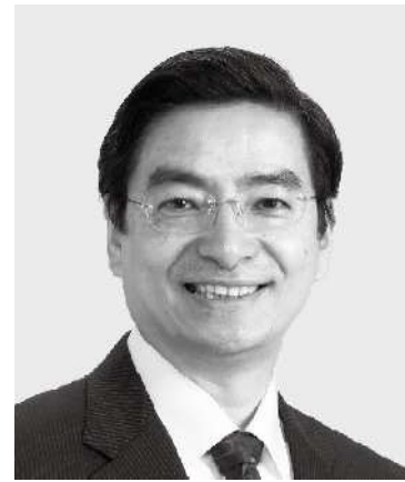
やま もと 山本 ひろし 現 役職:元財務大臣政務官。 参院議員2期。 経歴:慶應義塾大学法学部卒。 年齢:64歳 現場直結で障がい者支援と 地域復興