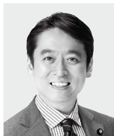
ひら き 平木 だいさく 現 役職:元経済産業大臣政務官。 参院議員1期。 経歴:東京大学法学部卒。 年齢:44歳 未来をひらく 確かな実力!