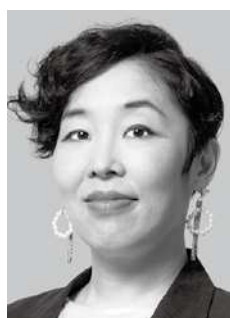
おしどり マコ 新・44