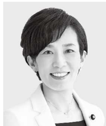
やま もと 山本 かなえ 現 役職:元厚生労働副大臣。 参院議員3期。 経歴:京都大学文学部卒。 年齢:48歳 「あなたの声を、かなえるチカラ。」