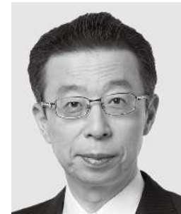
はまの 浜野 よしふみ 参議院議員 現職 まっすぐに力強く！ 働く仲間のために！