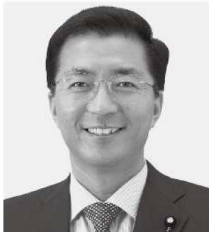
党副委員長 山下 よしき 現 59歳。参院議員3期。 活動地域 大阪、兵庫、滋賀、奈良、和歌山