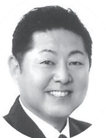
つねよし 太吾 だいで