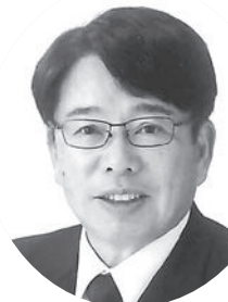
か新 ね川 は床 る (現職 七期)