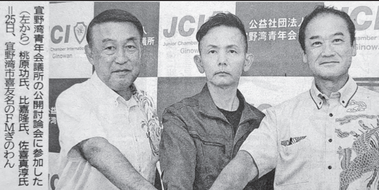
宜野湾JC公開討論会