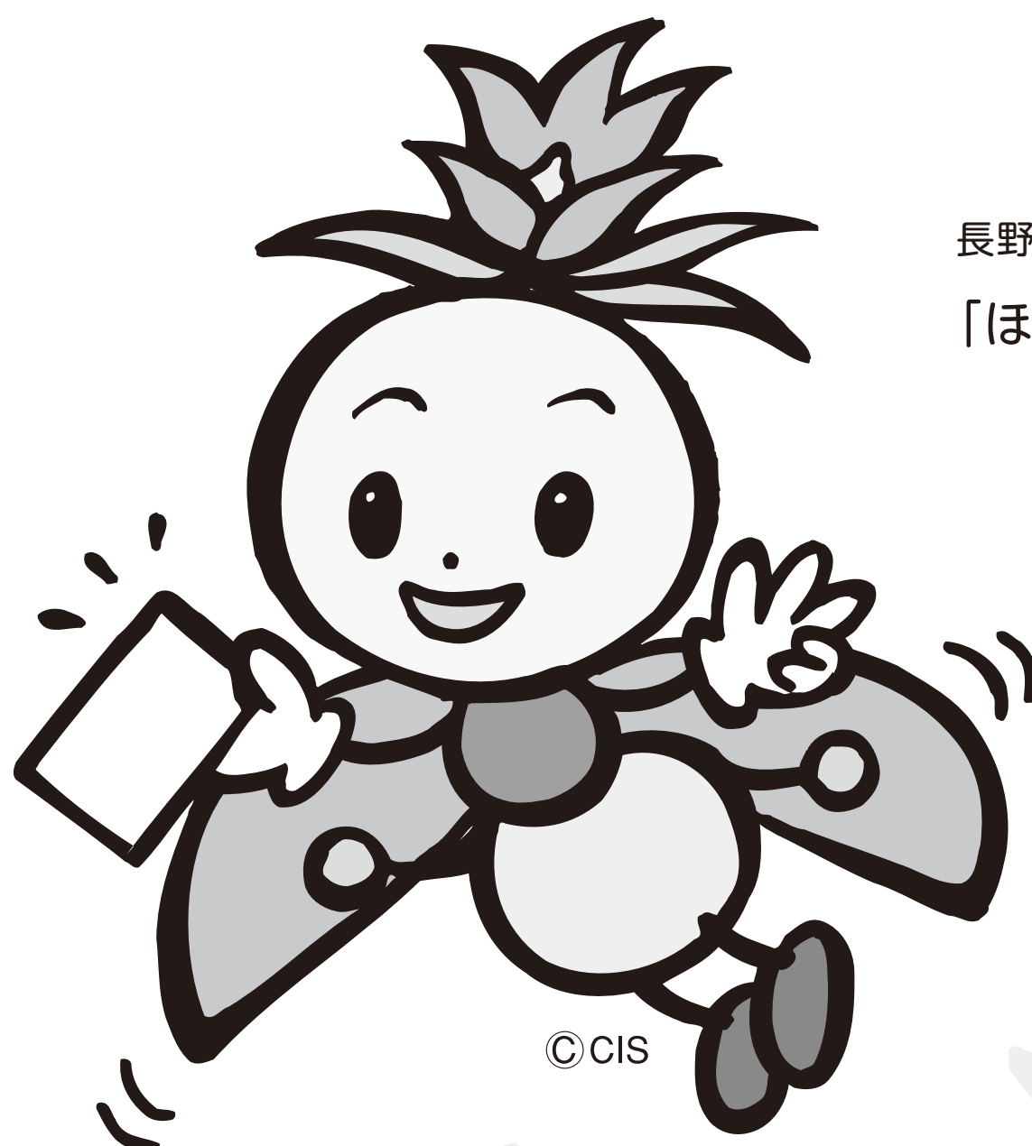
長野県選挙啓発マスコットキャラクター 「ほたりちゃん」