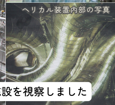
ヘリカル装置内部の写真