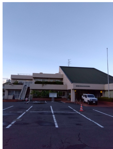
コミュニティセンター