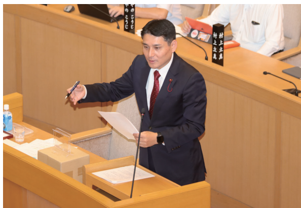
本会議場で市民の切実な声を伝える

一方で、神戸高速鉄道で子育て支援として実施されている小児用ICカードで乗車すると、運賃の50%相当の割引・ポイント還元がされる同様の施策の試行運用を検討するとの答弁があり、大幅な運賃割引が期待できます。また、この割引制度は大人の同行に関係なくこどもだけでの利用も対象となることから、塾や習い事等の適応範囲が広いことが魅力的です。これからも市民の声を神戸市に届け、カタチにしていきたいと思います。