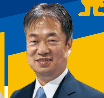
参議院議員 竹詰 ひとし