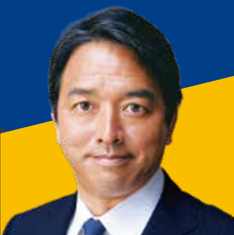
参議院議員 榛葉 賀津也