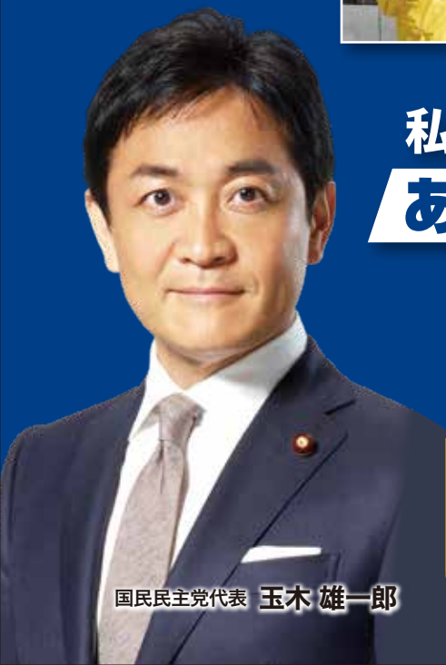
国民民主党代表 玉木 雄一郎