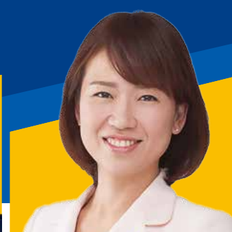
参議院議員 伊藤 孝恵