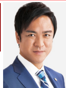
ゲスト：西野 修平 (河内長野市長)

府議会議員として地域と行政をつなぐ活動を常に心がけております！！ 府政を身近に感じてもらうために活動報告会を定期的開催しています。