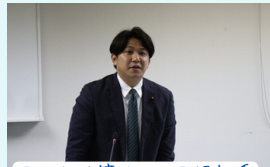
民泊を所管する区民福祉委員会 の副委員長として発言