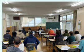
住民との民泊意見交換会を開催 ご意見はパブコメとして提出

昨年12月10日、「墨田区住宅宿泊事業の適正な運営に関する条例」および「旅館業法施行条例の一部を改正する条例」が本会議にて全会一致で可決。令和8年4月1日から施行されます。区議会は付帯決議(※)を付して賛成しました。住民の皆様からご要望の多い「既存施設への適用」は、財産権の侵害等による訴訟リスクが懸念されるため適用除外となりますが、本条例を運用していく中で毎年度検証を行い、必要であれば条例の見直しも行っていきます。