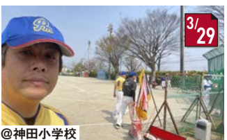
とうちゃんソフト開幕戦 初戦は勝利!活躍を目指して頑張ります!