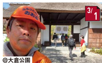
ふるさとガイド(防空壕ガイド) さわやかウォーキングもあり、賑わいました。