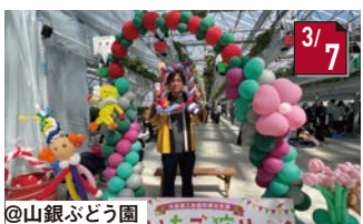
商工会議所横北支部いちご狩り 多くの皆さまにご参加いただきました。