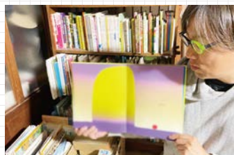
自宅にて、絵本の読み聞かせのひとつ。

おおぶ文化交流の杜図書館について、その優れた施設力と専門人材の力は、まだまだ発揮できる余地があると思う。学校との連携についても、個別の取組にとどまることなく、より一体となって子どもたちの学びと成長を支える存在になることを期待している。また、図書館利用者カードの発行についても、現在の取組に加え、より積極的に利用の裾野を広げていく視点を持って取り組むことを期待している。さらに、図書館運営を支えているボランティアグループの存在は極めて大きいものである。活動される方の誇りやモチベーションの向上という観点からも、ぜひ「絵本で育てるまち大府」推進の取組を力強く進めていただきたい。