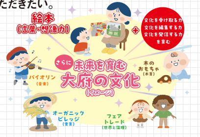
※近年の取組を抜粋したものであり、大府の文化を全て表現したものではありません。