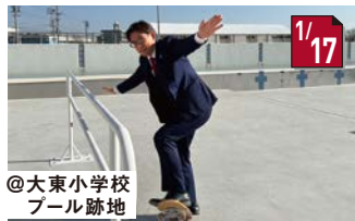
スケートパークおおぶ内覧会 ついに!大府にスケートパークが誕生!