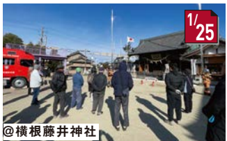
横根藤井神社防火訓練 地域の文化財を、火災から守りましょう。