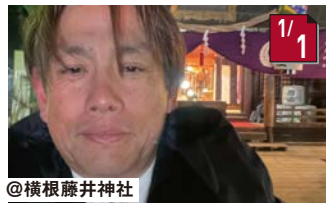
横根藤井神社 横根藤井神社歳旦祭 毎年、午前2時から執り行います。