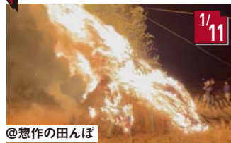
左義長 燃え上がる炎は圧巻。無病息災を祈ります。