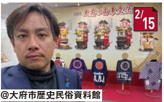
大府の山車文化見学 見応え抜群、横根の誇りが勢揃い!