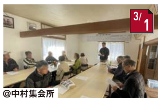
中村集会所改修お披露目 地域の方のご協力により、とても綺麗に!