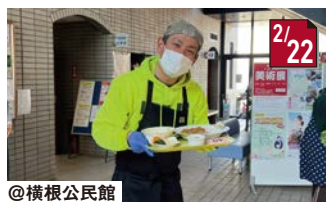
食堂とんからりんOPEN 横根にも全世代型サロンが誕生しました!