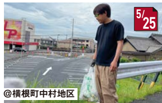
#530(ごみゼロ)運動 なかなかゴミが集まらずたくさん歩きました!