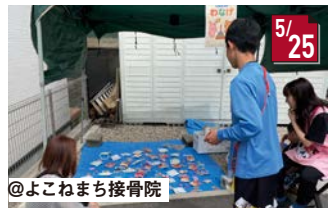
#よこねまちマルシェ 家族でゲームや飲食を楽しみました!