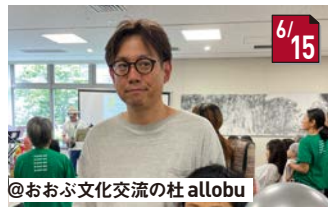
#明日の子どものピースフェス クイズは全問正解しました!