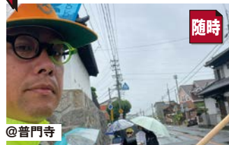
#交通立哨 登校を定期的に見守っています!