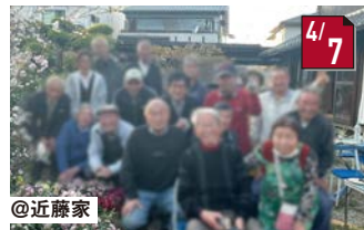
#桜を見る会 お招きいただき、素敵な時間を過ごしました!