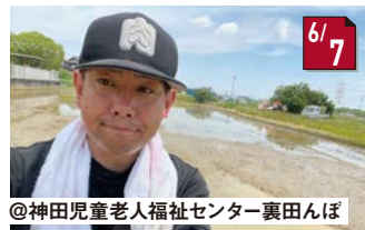
#田植え体験 足がハマって大変でした!