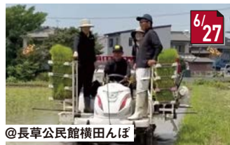
#おおぶニック学校給食米田植え 田植え機を操作させていただきました!