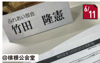
#ふれあい部会 横根夏まつり(8/9)に向けての話し合い!