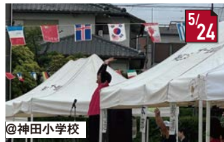
#神田コミュニティ運動会 PTAとして進行係をつとめました!