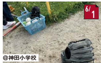
#どうちゃんソフト ついに打ちました!ホームラン!!