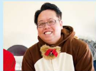
クリスマス会(子育てサロン)