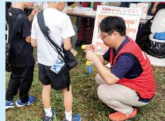
千種区民まつり(メタセコイア広場)