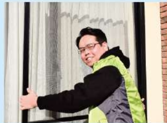
網戸張替え(すけっと工房)