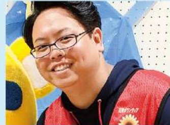
家族でまなぼうさい(モビリティゲート吹上)