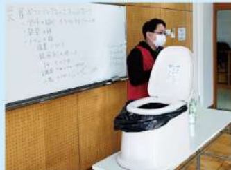
防災訓練トイレ講習(内山小学校)