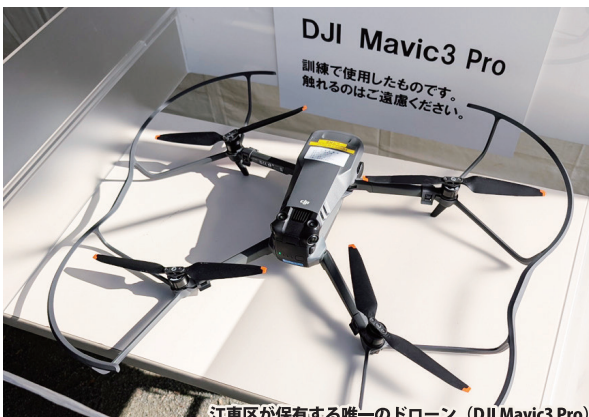
江東区が保有する唯一のドローン (DJI Mavic3 Pro)