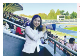
東京2025デフリンピック(駒沢オリンピック公園総合運動場) 「サインエール」で選手を応援しました!