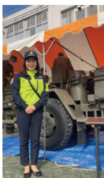
めぐる防災フェスタ(目黒十中) 人気の自衛隊カレーをおいしく頂きました。