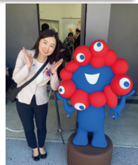
大阪・関西万博(EXPO2025) 目黒区に大使館がある国のパビリオンを視察