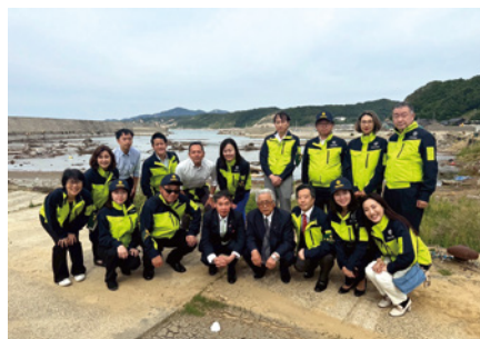
能登半島地震の被災地を訪問(石川県輪島市) 「住宅の確保」と「生活の再建」が課題。輪島塗などの伝統工芸や漁業など地域産業をどう復興・継承するか。