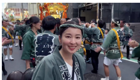
八雲氷川神社例大祭 地域の方々のご尽力によって、伝統行事が継承されています。