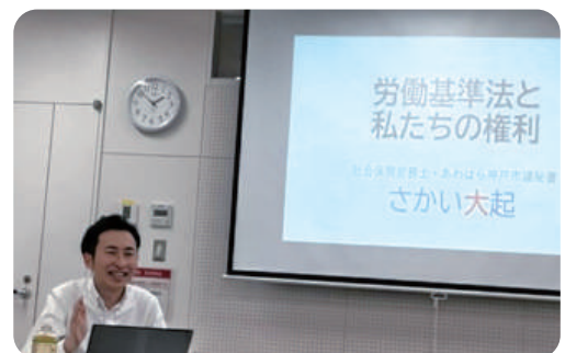
社会保険労務士として講演活動を行っています。