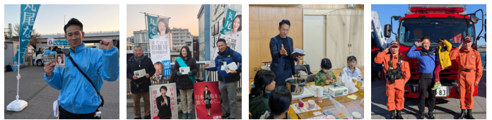
毎日の駅立ちをはじめ、さまざまな場所で区民の皆さんとの触れあいに感謝と喜びを感じています