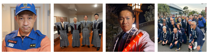
消防団、地域活動、防災訓練、イベントなど、さまざまな場所で金沢区の交流、活動に参加しています