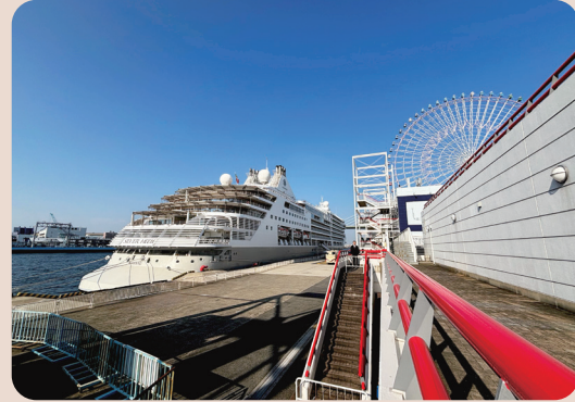
▼天保山客船ターミナル

クルーズ船かあ〜。憧れるけど、高級なイメージ！ 経済発展は嬉しいけど、どれくらい需要があるんやろ？