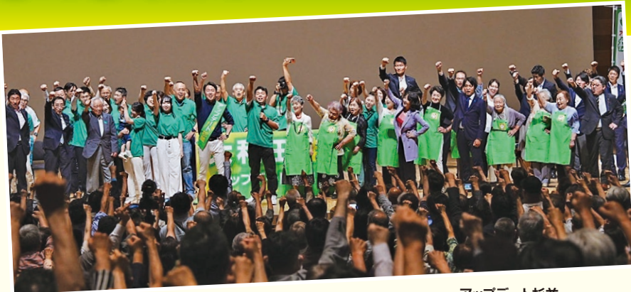
アップデート杉並