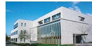
※神戸市中央区脇浜海岸通心のケアセンター