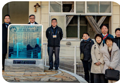
安心社会づくり対策特別委員会県外視察（仙台市、世田谷区、金沢市）仙台市では東日本大震災で被災した荒花小学校を訪問し、当時の被災状況とこれからの「防災環境都市づくり」を学びました。(1/27-29)

予算特別委員会が約3週間にわたって開催されました。私は、厚生関係・消防上下水道関係・建設関係・経済観光環境関係を担当し、令和8年度予算について質疑しました(3/2-26)