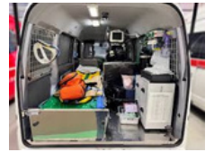
南消防署似島出張所の軽救急自動車