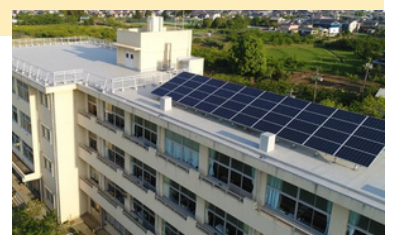
小田原市立曾我小学校

地球温暖化対策課長 避難所に指定されている学校施設に太陽光発電設備の導入を教育委員会と連携しながら積極的に検討を進めていきたい。