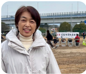
広島市消防出初式。市消防局職員や消防団員たち計約650人が参加。公開訓練を通して防災や防火への決意を新たにしました。新しい年に災害や火災で被害が出ませんように。(1/5)

安全安心安芸区民大会。県警から特殊詐欺被害が過去最大となったと報告あり、巧妙な手口への対策、区民の皆さんに注意喚起のための演劇などの発表がありました。(1/25)