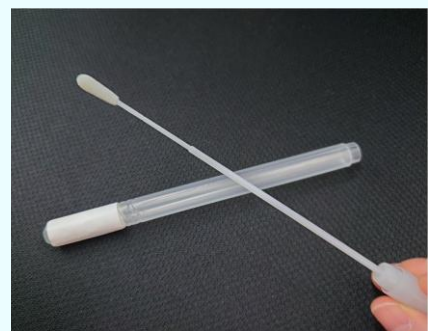
↑ 口の中をこするだけでOK

18歳～54歳まで登録できる骨髄バンクですが、55歳の誕生日とともに自動的に「卒業」となってしまいます。数年後には登録者数が40%も減少してしまう見込みで、命をつなぐ大切な事業がピンチを迎えています。日本骨髄バンクでは自宅で採血なし、郵送で行える「スワブ登録」の今年度からの実施を目指しており、特に若い世代の登録を期待しています。私は以前から骨髄バンクの支援に取り組んでおり、ドナーへの市の助成金などを実現してきました。今回もスワブ登録が開始した際には、周知啓発を市民や学校等に行い、その活動が衰退しないように協力を求めました！