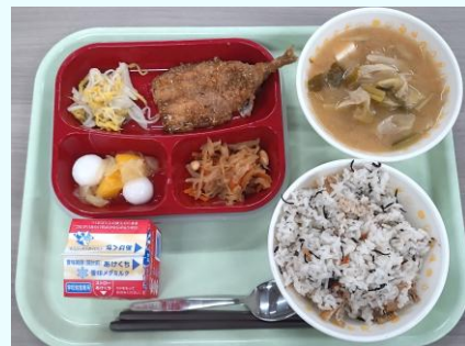
↑ 議会の試食会で配膳から同じ流れで行いましたが、やはり食べる時間が短く感じました。