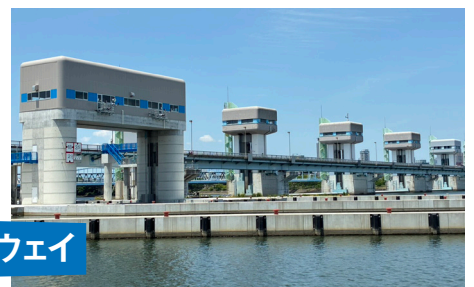
淀川ゲートウェイ

公明党が推進し、2026年3月に完成。水辺空間を生かした観光やにぎわい創出、災害時の舟運活用にも期待。