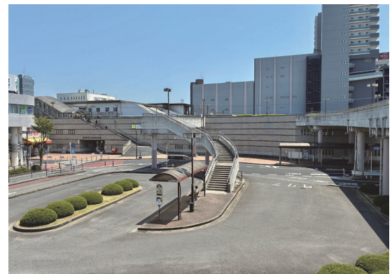
再整備計画の延長が発表されたJR成田駅西口

計画がスタートしてから6年間、その進捗状況が市民に知らされてこなかったことも大問題ですが、その中止が周知されていないことも無視できません。