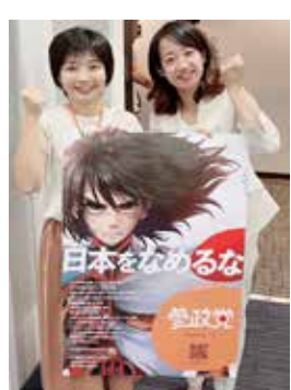
参政党代表 / 参議院議員 神谷宗幣と

2024年の衆院選では新たに3人の国会議員が誕生し、衆参合わせて4人の議員、地方議員を合わせると全体で140名を超える議員が所属し、全国にいる党員が信念を持ってボランティアで支える「小さいけれど力強い政党」。それが参政党です。